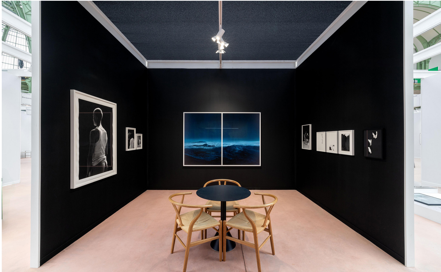
Paris Photo 2024, Grand Palais, Paris. Vue du stand, Galerie Bacqueville.