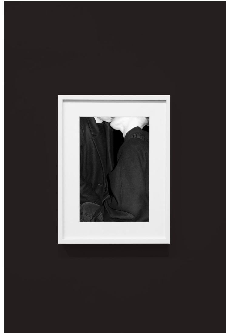
L'Amour seul brisera nos coeurs, Sans titre 01, 2020-2023 Tirage sur papier Hahnemühle Photo Rag 308g. Cadre érable laqué blanc, verre musée 2mm Passe-partout blanc simple ouverture. 30 x 40 cm