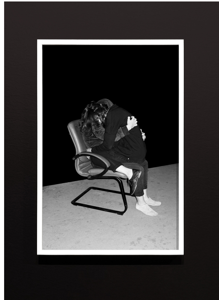
L'Amour seul brisera nos coeurs, Sans titre 02, 2020-2023 Tirage sur papier Hahnemühle Photo Rag 308g. Cadre érable laqué blanc, verre musée 2mm 40 x 60 cm