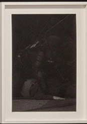
Paris Photo 2024, Grand Palais, Paris. Vue du stand, Galerie Bacqueville.