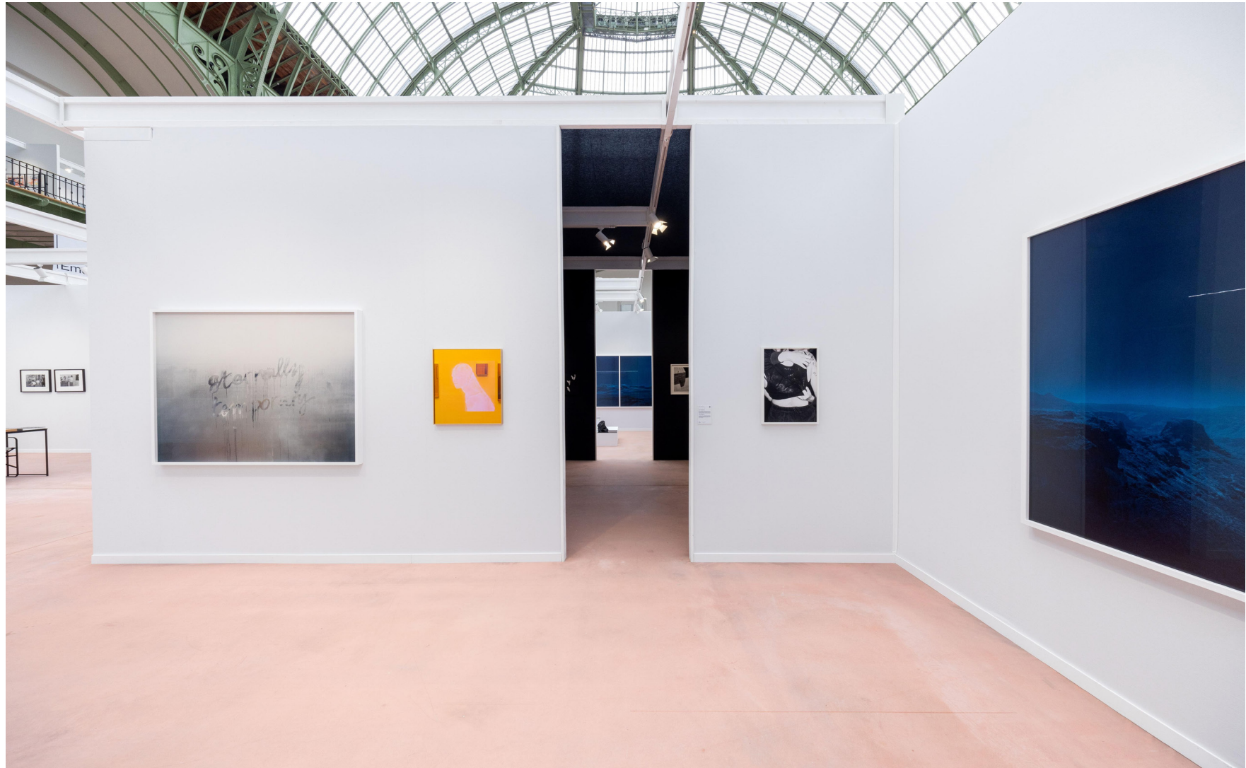
Paris Photo 2024, Grand Palais, Paris. Vue du stand, Galerie Bacqueville.